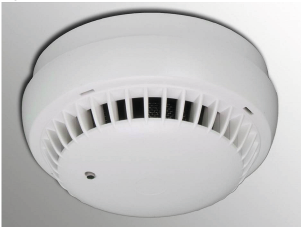
Abbildung 1: RM 3000 Figure 1: RM 3000

The smoke detector; type RM 3000 (VdS-No.: G 203036) or type RM 2860 (VdS-No.: G 200017), automatically triggers the smoke and heat exhaust vent system when the alarm value of 3 % smoke mass is reached.