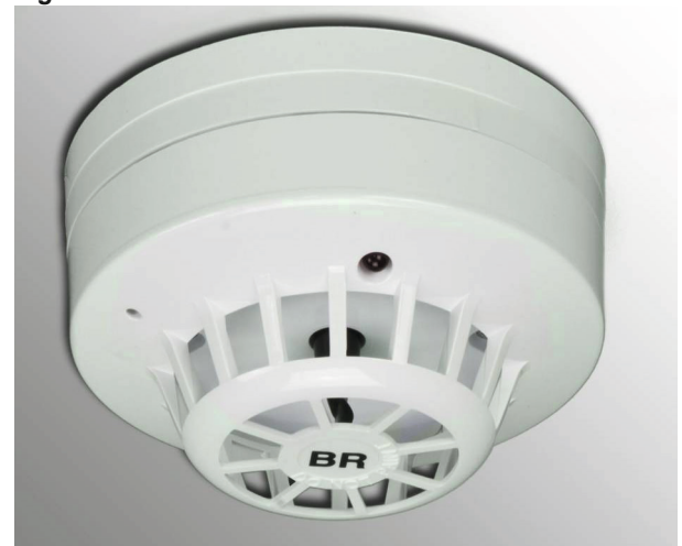
Abbildung 2: TH 4860 Figure 2: TH 4860

The heat detector, type TH 4860 (VdS-No.: G 200060), is equipped with two thermal sensors, one enclosed in the housing and the other exposed to the adjacent atmosphere. Under normal conditions both sensors indicate the same temperature. In the event of a fire, the outer sensor detects the change in temperature considerably faster, so that the sensors register different temperatures. This causes an alarm to be registered and triggers the connected smoke control system. Transfer contact max. 1 A load.